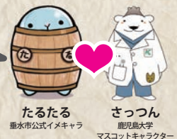
たるたる 垂水市公式イメージキャラクター